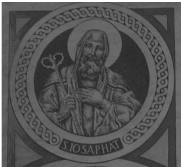
Šv. Juozapas Kuncevičius. Lentvario Viešpaties Apreiškimo Švč. M. Marijai bažnyčios sienos tapybos fragmentas

1642 m. popiežiaus Urbono VIII buvo beatifikuotas Polocko arkivyskupas Juozapas Kuncevičius. Jo kultas greitai plito ne tik Graikų apeigų katalikų Bažnyčioje, bet ir tarp lotynų apeigų Bažnyčios tikinčiųjų. Dar iki