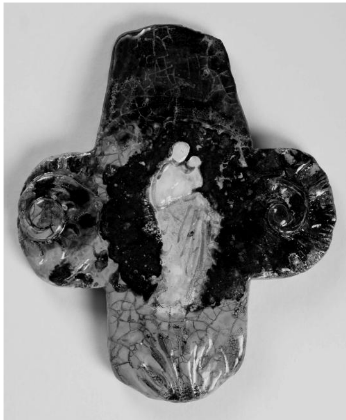
Kalėdinis kryžius. 2003. Glazūruota keramika.

Jūsų pašaukimas yra labai reikalingas: Lietuvai, Europai ir pasauliui. Kunigas yra Dievo bendražygis ir žmogaus palydovas. Ne dievaitis ir net ne vadovas, bet palydovas, labai reikalingas šiandieniniam žmogui. Turite suprasti, kad jums duota daug, turėsite papildomą galią ir