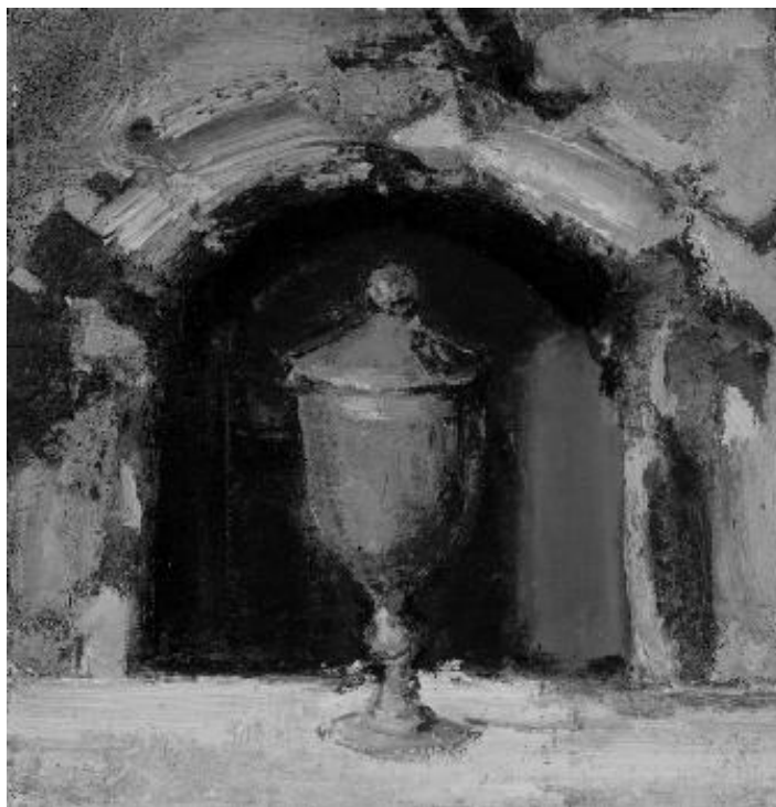
Tabernakulis. 1986. Drobė, aliejus.

teisę veikti Viešpatie vardu. Kol ruošiatės konsekracijai, labai svarbu, kad indas, kurį šiuo metu žiedžiate, būtų stiprus, tvirtas ir kartu jaukus, kad Dievo malonė ir Šventoji Dvasia rastų jumoje vaisingą lizdą.