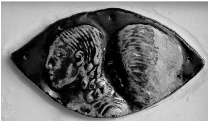
Angelas. 2007. Keraminio pano fragmentas.

Kūrybinis augimas sutapo su žmogiškuoju brendimu. Tai buvo karštas, aistringas ėjimas. Bet galutinai