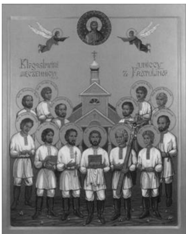
Ikonoje pavaizduoti palaimintieji Pratulino kankiniai

Po Abiejų Tautų Respublikos padalinimų dauguma rusėnų pateko Rusijos valdžion. Unitų Bažnyčia buvo persekiojama, o vėliau jėga likviduota ir prijungta prie Rusijos stačiatikių Bažnyčios (1839 m. Polocko sinodas). Rusijos imperijoje ilgiausiai (iki 1875 m.) išsilaikė Kolmo unitų vyskupija (1996 m. Lenkijoje Jonas Paulius II beatifikavo 13 Pratulino miestelio unitų tikinčiųjų, kurie 1873 m. sausio 24 d. caro kareivių buvo nužudyti už atsisakymą perduoti savo bažnyčią