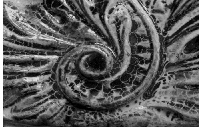
Genezė. 2002. Glazūruota keramika, fragmentas.

kriščiioniškai – maždaug apie 1982 m. – nepasakyčiau, kad tapo gyventi lengviau. Aplinka buvo nepalanki mūsų praktikavimui. Sovietmečiu tai nebuvo ir labai atsargu. Bet mes nepaisėme jokio atsargumo. Meldėmės ir vieni už kitus, ir už tėvus, kitus artimuosius.