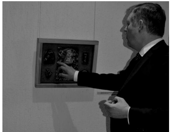
Keraminis pano iš 2010 m. kolekcijos